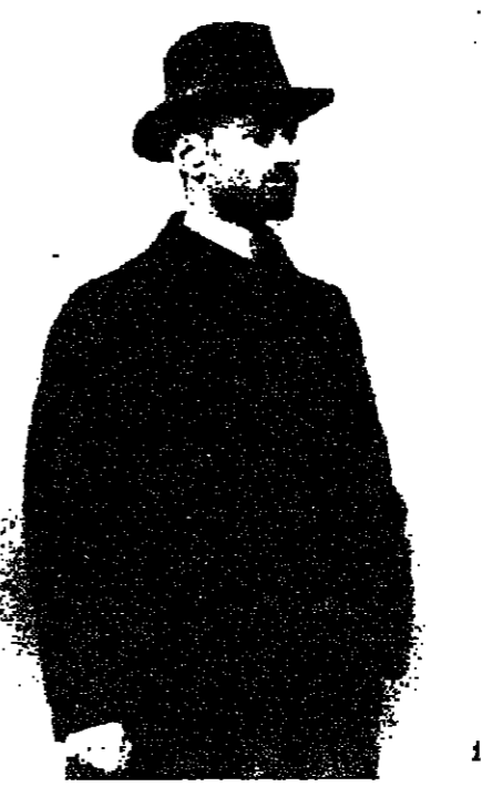
كوميدياس طالب في برلين